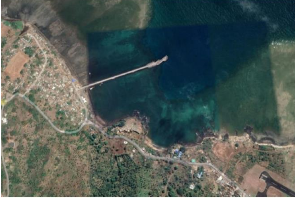
Port de BOINGOMA

La description des infrastructures existantes sera donnée plus précisément dans le Dossier d’Appel d’Offres. Il est proposé aux candidats de réaliser une visite de site dès cette phase de Sélection Initiale, afin que les candidats puissent voir l’état actuel des ouvrages existants et poser les questions nécessaires lors de cette visite de site.