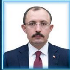
Dr. Mehmet MUŞ Türkiye Cumhuriyeti Ticaret Bakanı