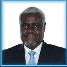
Moussa Faki MAHAMAT Afrika Birliği Komisyonu (AfB) Başkanı