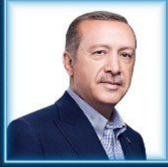
Recep Tayyip ERDOĞAN Türkiye Cumhuriyeti Cumhurbaşkanı

“Derinleşen Türkiye-Afrika Ortaklığı: Ticaret, Yatırım, Teknoloji ve Lojistik”