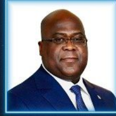
Félix Antoine Tshisekedi TSHILOMBO AfB Dönem Başkanı & Kongo Demokratik Cumhuriyeti Cumhurbaşkanı