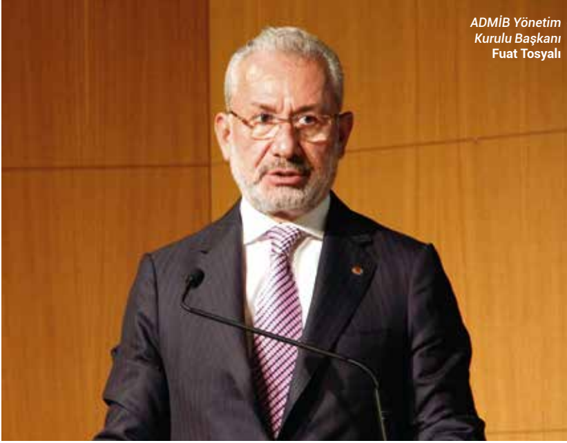
ADMİB Yönetim Kurulu Başkanı Fuat Tosyalı