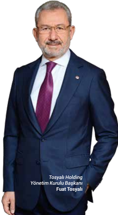
Tosyalı Holding Yönetim Kurulu Başkanı Fuat Tosyalı

tegre edecek tesisimiz, dijital dönüşümün dünya çelik üretimindeki en iyi örneklerinden biri olacak." diye konuştu.