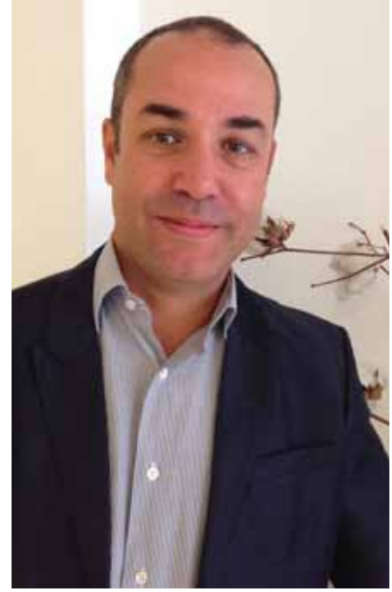
İPUD Yönetim Kurulu Başkanı Leon Piçon

Sektörel örgütlenmelerin deneyim ve gücünü bir araya getirerek oluşturulan İPUD, halen üyelik başvurularını kabul etmeye devam ediyor. Pamuk üreticileri, çırçır işletmeleri, pamuk tedarikçileri, tekstil ve hazır giyim kuruluşları, perakende zincirleri ve markaları, ayrıca dernek faaliyetlerine katkıda bulunabilecek sivil toplum kuruluşları gibi birçok konuda farklı bilgiye sahip kişi