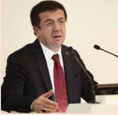
NIHAT ZEYBEKCI EKONOMİ BAKANI