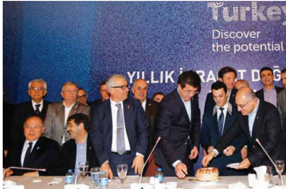
2014 İhracat ve Ekonomi Değerlendirme ve Genişletilmiş Başkanlar Kurulu Toplantısı'nın ardından, Bakan Zeybekci'nin doğum günü sebebiyle sürpriz bir doğum günü pastası kesildi.