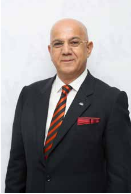
Akdeniz Kimyevi Maddeler ve Mamulleri İhracatçıları Birliği Yönetim Kurulu Başkanı